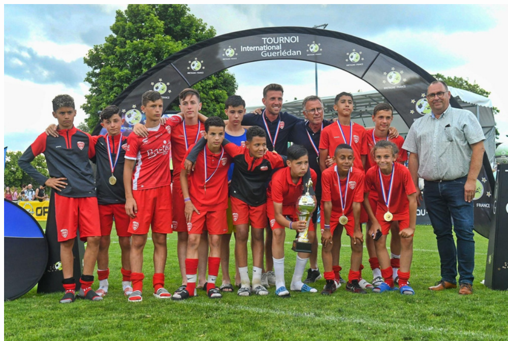
Photos : Tournoi international de Guerledan

> Les féminines de Nîmes Métropole, également engagées à Guerledan, ont fini 31es sur 80. Deuxièmes de leur poule de B, elles ont été éliminées en 2e phase par Gérone (Espagne), futur finaliste battu par l'Olympique Lyonnais.