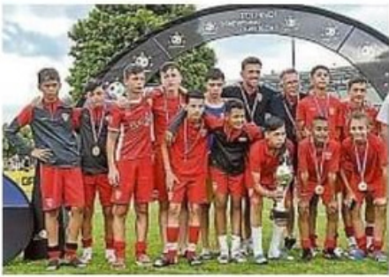
Décus après la finale, les Crocos peuvent être fiers de leur tournoi.

Nos U13 ont fait un remarquable parcours et se sont hélas inclinés en Finale le dimanche 11 Juin 2023 à Pontivy face au Deportivo la Corogne (Espagne) et termine donc 2ème de ce prestigieux tournoi. Bravo à nos joueurs et à leurs coachs.